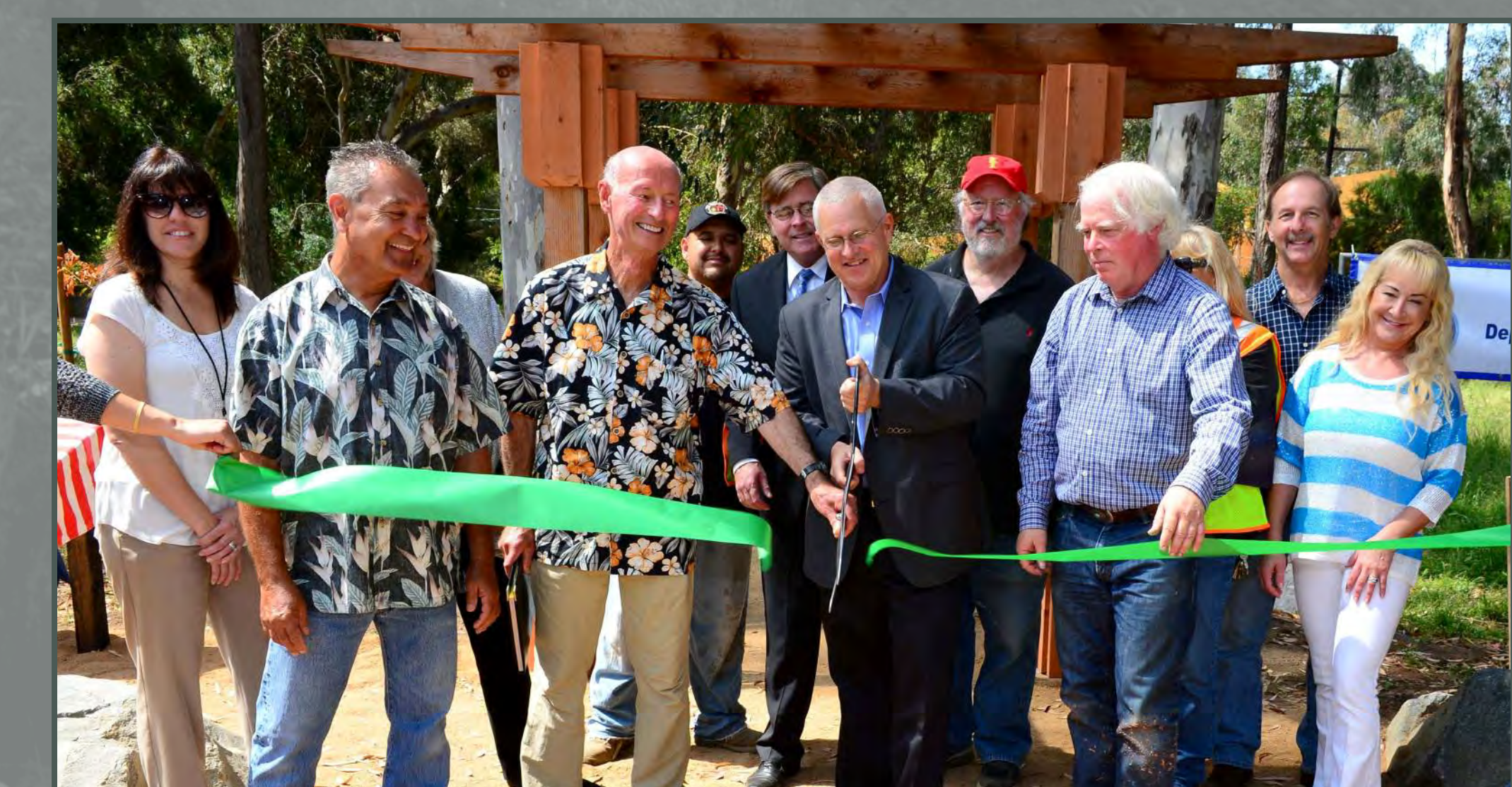
Rehabilitation of historic Eucalyptus Grove, Rustic Canyon Recreation Center